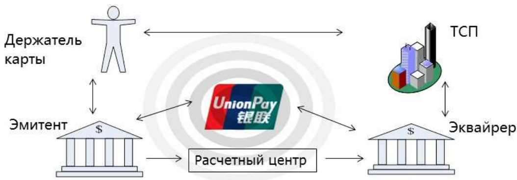
Типичная транзакция при купле-продаже товаров и услуг

2) в типичной операции по оплате товаров и услуг по Карте UnionPay участвуют четыре стороны: Держатель карты, ТСП, Эмитент и Эквайер. Типичная операция покупки показана на следующей схеме-;